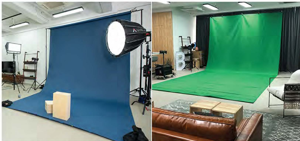
Photo Backdrop Area